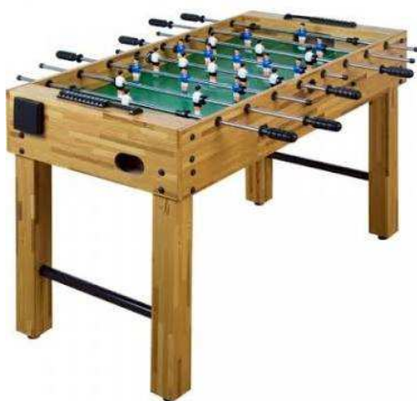
D1.9N Stolní fotbal samostatně stojící = 1ks