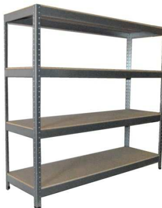
A1.2N Regálová soustava kovová 3200x600x2000mm-výrobek na zakázku=2ks