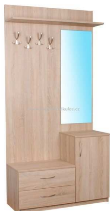
B3.3N Věšáková stěna 1200x2000mm – výrobek na zakázku = 1ks