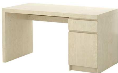
C4.1N Psací stůl 1000x600mm s uzamykatelným kontejnerem – výrobek na zakázku = 2ks