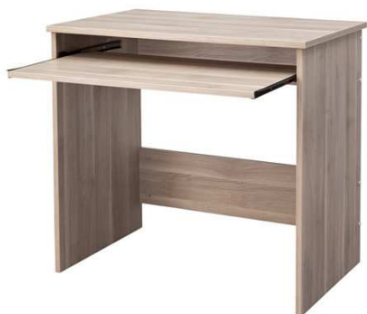
B1.3N Pracovní stůl 1500x600mm výsuvný – výrobek na zakázku = 1ks