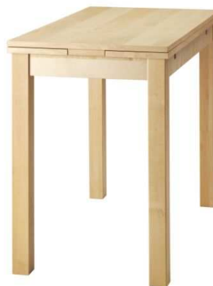
D1.2N Stůl čtvercový rozkládací = 1ks 2500(1000)x1000mm – výrobek na zakázku