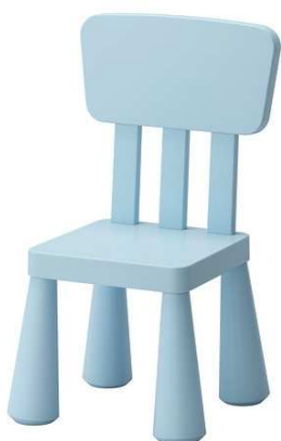
B3.5N Dětská židle barevná plastová = 6ks