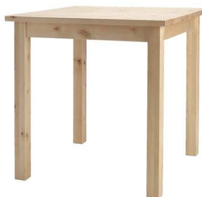
C1.2N Stůl pro klienty 600x600mm – výrobek na zakázku = 1ks, může být rohový