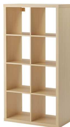
B4.4N Skříň na šanony 1200x500x2000mm – výrobek na zakázku = 2ks