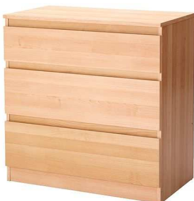
D1.5N Komoda šuplíková 3 šuplíky = 2ks 1200x500x1000mm, výrobek na zakázku