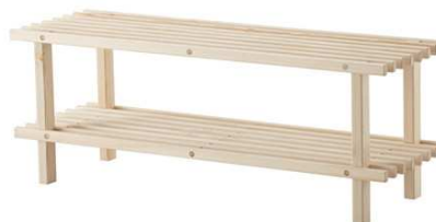
B1.2N Botník malý 1000x400x900mm – výrobek na zakázku = 1ks