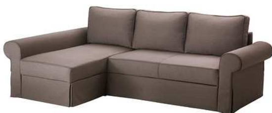
C2.1N Rohová sedací souprava 3+2 = 1ks