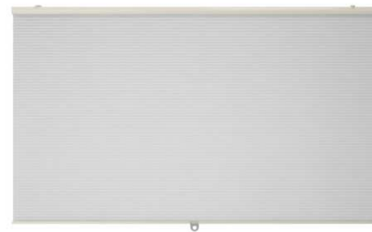
C2.6N Žaluzie = 2ks