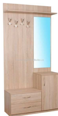
C4.5N Věšáková stěna se zrcadlem = 1ks 1000x2000mm - výrobek na zakázku