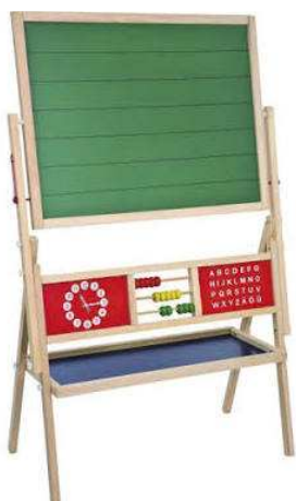
B2.7N Dětská tabule = 1ks