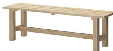
B3.2N Lavička na obouvání 1200x400x600mm – výrobek na zakázku = 1ks