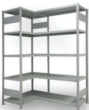
A1.3N Regálová soustava kovová (4500+3000)x600x2000mm – výrobek na zakázku = 1ks