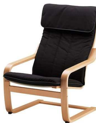
C2.2N Křeslo = 1ks