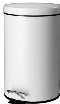
D1.6N Odpadkový koš = 3ks