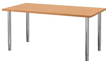
C1.1N Kancelářský stůl 1000x600mm – výrobek na zakázku = 2ks