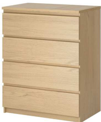
B2.3N Komoda 1200x500x2000mm – 4 šuplíky, výrobek na zakázku = 2ks