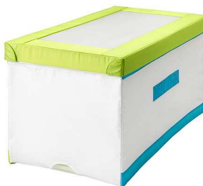
B3.6N Box pro děti malý 600x600mm = 3ks