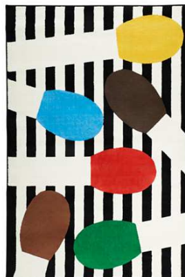
D1.8N Koberec rozbalovací = 1ks