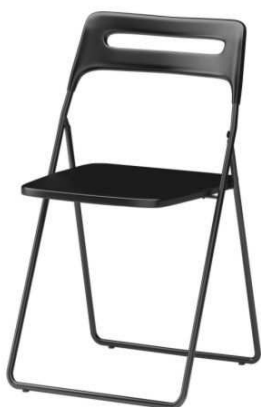
C1.3N Plastová židle pro klienty = 2ks