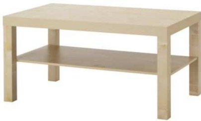
C2.3N Konferenční stolek 1500x600mm – výrobek na zakázku = 1ks