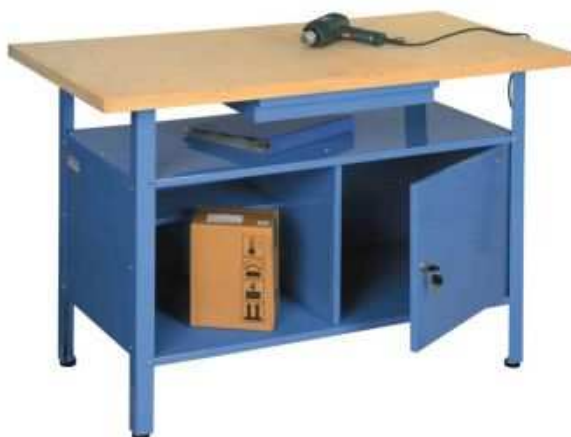
A1.4N Pracovní ponk 1500x750mm – výrobek na zakázku = 1ks