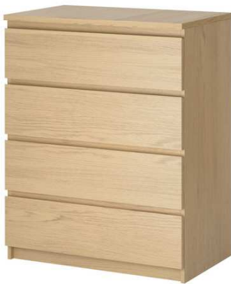
C2.5N Komoda 1200x500x1200mm 4 šuplíky, výrobek na zakázku = 1ks