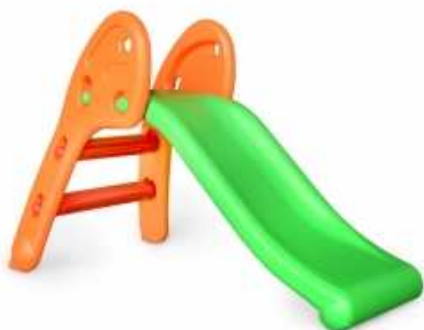
B2.5N Dětská plastová skluzavka = 1ks