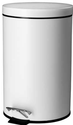
C2.7N Odpadkový koš = 1ks