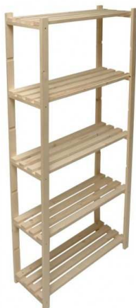
B1.1N Regál 1700x500x2000mm – výrobek na zakázku = 2ks