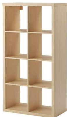
C1.6N Nástěnná závěsná police = 2ks 1200x500x2000mm – výrobek na zakázku