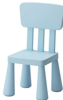
B2.2N Dětská židle barevná plastová = 12ks