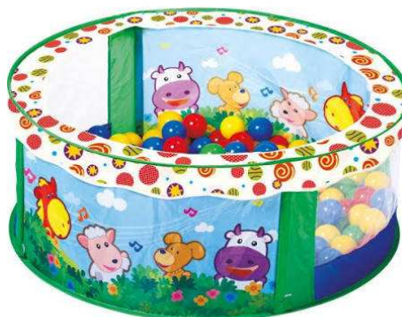
B2.6N Dětský plastový bazének s balónky = 1ks