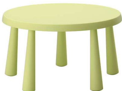
B2.1N Dětský stůl barevný plastový = 2ks