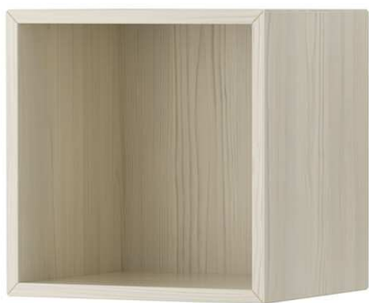
D1.7N Police na reproduktory (rohová) – výrobek na zakázku = 1ks