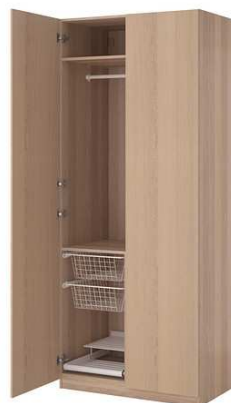
B2.4N Skříň 1200x600x2000mm – výrobek na zakázku = 1ks