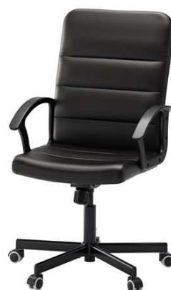
C1.4N Kancelářská židle pojízdná, 2ks