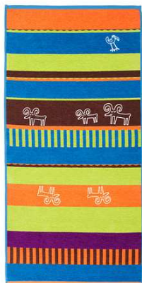
B3.7N Dětský koberec tmavě modrý nebo zelený = 1ks