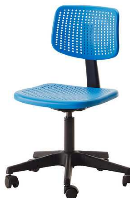
B1.4N Kancelářské židle = 2ks