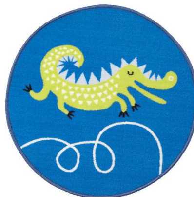
B2.8N Dětský koberec = 1ks