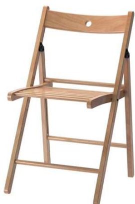
D1.3N Rozkládací židle = 20ks