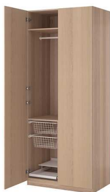
C4.3N Šatní skříň uzamykatelná = 1ks 750x600x2000mm – výrobek na zakázku