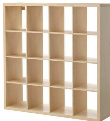
C1.7N Skříňka na šanony – výrobek na zakázku = 2ks